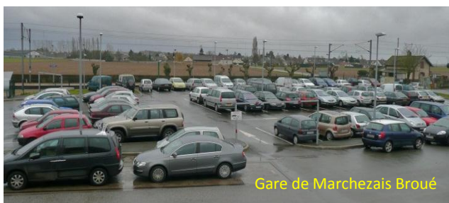
Gare de Marchezais Broué

L'étude de diagnostic visant à décrire les scénarii d'amélioration du stationnement et de la desserte de la gare, s'est achevée. Un projet des travaux devrait être adopté en fonction des capacités de financement du budget 2012. L'orientation retenue est de limiter l'affluence qui ne cesse de croître. Différentes mesures ont été envisagées et seront mises en place de façon progressive. Il s'agit tout d'abord de sécuriser les lieux. L'extension actuelle sera traitée en enrobé et équipée d'éclairage public. L'ensemble du parc de stationnement sera borduré. Il s'agit ensuite de favoriser les modes d'accès alternatifs à l'usage personnel de l'automobile. Le cheminement piéton à partir du hameau de Marolles et de Marchezais sera amélioré notamment sur les traverses de route et à l'intérieur du parking, des emplacements de covoiturages seront réservés dans les bourgs centres les plus proches, Abondant et Bû. Une tarification du stationnement sera mise en place dans une gamme de prix comparable à celle de la gare la plus proche c'est-à-dire Houdan. Enfin, à la demande de la Communauté de Communes, le Conseil Régional a sollicité la SNCF, afin de rétablir une billetterie automatique.