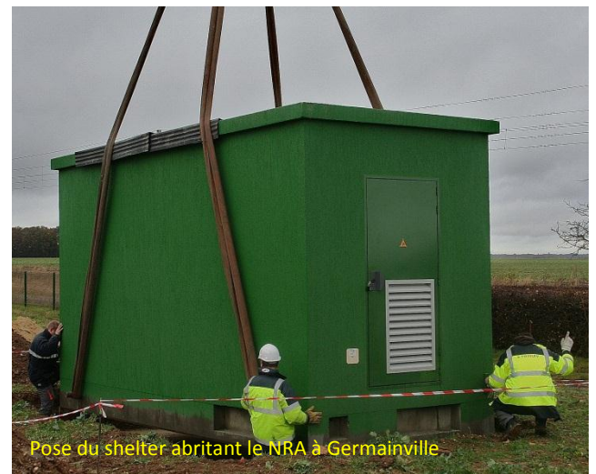
Pose du shelter abritant le NRA à Germainville

Le très haut débit de 100 Mb/s dessert désormais « Actipôle 12 », grâce au partenariat engagé avec France Télécom, un Nœud Réseau Abonnés (NRA) relié à la fibre optique a en effet été installé sur le site « les Merisiers » à