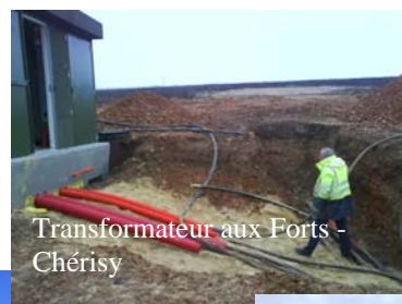
Transformateur aux Forts - Chérisy

Le permis de construire accordé fin 2007 pour 12 éoliennes de 2 MW chacune, qui a fait l'objet d'un recours auprès du Tribunal Administratif d'Orléans, de la part d'une association de riverains, de Germainville est toujours en instance de jugement. Pourtant, l'instruction est terminée depuis l'automne 2009.