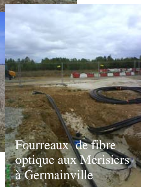
Fourreaux de fibre optique aux Merisiers à Germainville