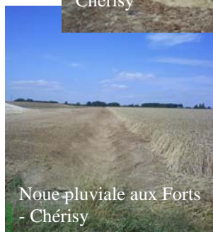
Noue pluviale aux Forts - Chérisy